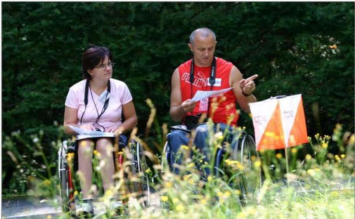
WTOC 2008 Olomouc