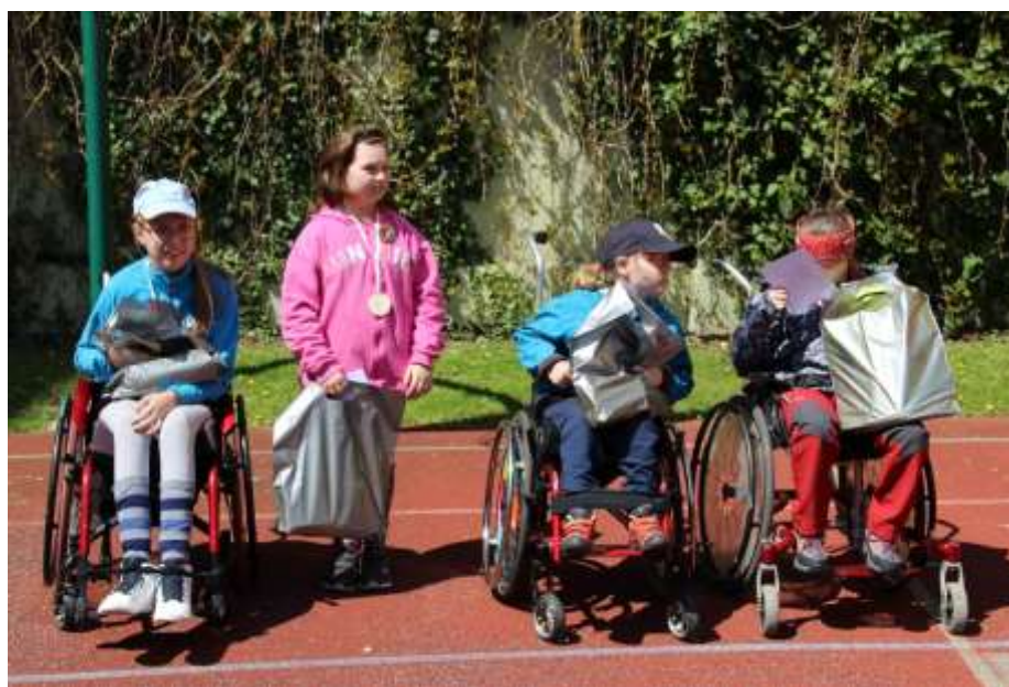
Rok 2018 – Městské sady Opava