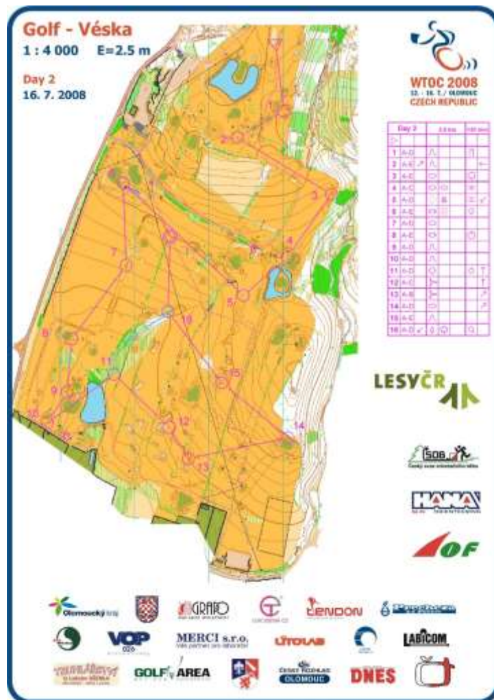
Ukázka mapy z Mistrovství světa v Trail-O (World Trail Orienteering Championship)