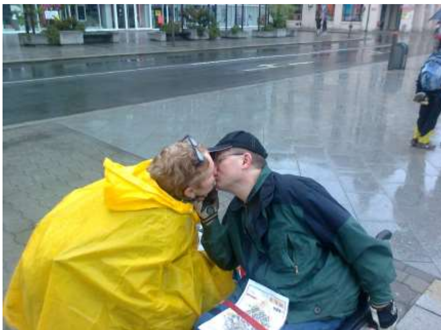
První máj v Opavě