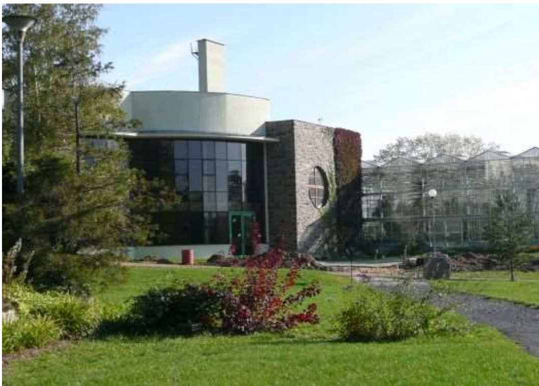
Arboretum Nový Dvůr je součástí Slezského zemského muzea v Opavě.