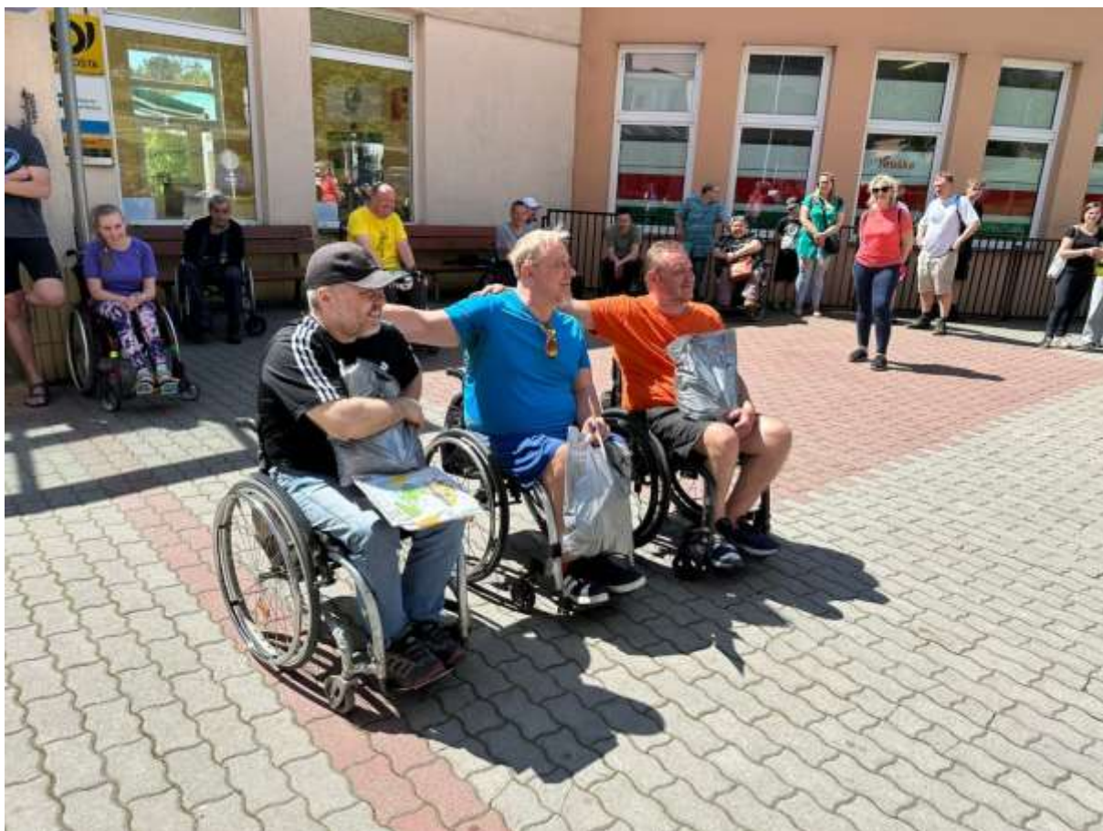
Vyhlášení výsledků závodu u kategorie mládež a kategorie mechanický vozík