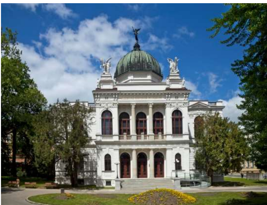
Rok 2024 – Hrabyně